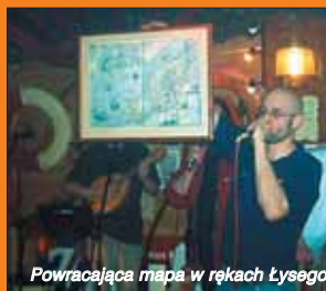
Powracająca mapa w rękach Lysego (Bezmiary)