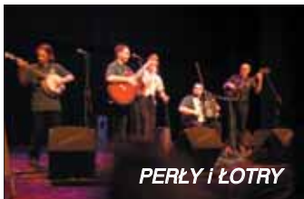
PERŁY I ŁOTRY