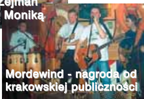
Mordewind - nagroda od krakowskiej publiczności