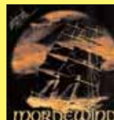
„Fala” - MORDEWIND