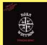
„Korsarska brać” - RÓŻA WIATRÓW