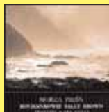
„Morza pieśń” KOCHANKOWIE SALLY BROWN

tu jest trochę inaczej. Nie da się bowiem na płycie oddać tego, co Banany wyprawiają na scenie. Dlatego płyta jest bardziej do słuchania niż do skakania. Z lampką wina, przy kominku, nastrojowo... polecam.