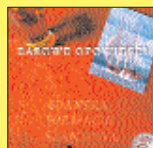
„Barowe opowieści” - GDAŃSKA FORMACJA SZANTOWA