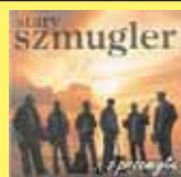
„...z przemytu” STARY SZMUGLER