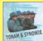
„Składanka” TONAM & SYNOWIE