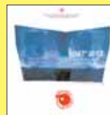
„Burza. Dekada Łotrów” PEŁRY I ŁOTRY